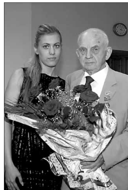
Фото с заседания ученого совета, посвященного юбилею И.И. Гудилина