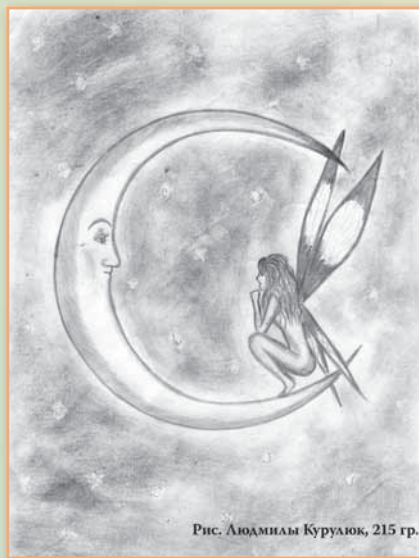
Рис. Людмила Куралюк, 215 гр.