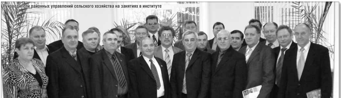
Руководители районных управлений сельского хозяйства на занятиях в институте