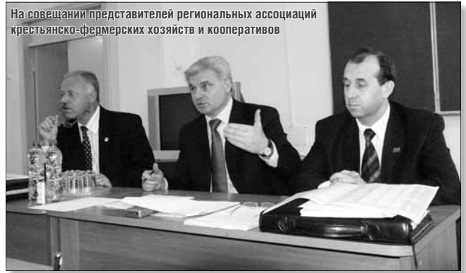
На совещании представителей региональных ассоциаций крестьянско-фермерских хозяйств и кооперативов

В марте 2007 года вышло распоряжение Правительства Российской Федерации о реорганизации примерно половины из имеющихся в стране семидесяти подразделений образовательных учреждений дополнительного профессионального образования (институтов повышения квалификации) АПК путём их присоединения к аграрным университетам. Вызвано это необходимостью создания системы непрерывного образования: подготовка специалистов — послевузовская подготовка — дополнительное образование. До 2007 года подготовку специалистов осуществляли вузы, там же проходила послевузовская подготовка — аспирантура, докторантура. Но дополнительное образование: повышение квалификации, профпереподготовка — шло в институтах повышения квалификации. Эти учреждения действовали независимо от вузов и являлись юридически самостоятельными лицами, хотя многие, так же как НГАУ и Новосибирский региональный институт повышения квалификации, осуществляли эту работу совместно.