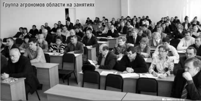
Группа агрономов области на занятиях

Сейчас изучается возможность расширить деятельность университета по подготовке рабочих кадров. В ИДПО уже сейчас ведут подготовку кадров по профессиям: операторы по производству стада, переработчики мяса и молока, машинисты холодильных установок, операторы котельной на различных видах топлива, электрогазосварщики, слесари по эксплуатации и ремонту газового оборудования, продавцы, контролёры-кассиры и т.д. — всего около восемнадцати рабочих профессий. Одно время у нас в ИИ и некоторых других подразделениях также велась подготовка рабочих профессий, а сейчас это может проходить под единым методическим руководством. Ещё есть перспективы расширения повышения квалификации по специальностям перерабатывающих отраслей. В ИДПО большой раздел занимает подготовка кадров для перерабатывающей промышленности, а по повышению квалификации специалистов работа проводится ещё недостаточно. Но в то же время у нас в БиТИ, АИ и в ИИ также есть кафедры и специалисты по перерабатывающим отраслям. Совместная работа позволит расширить эту деятельность.