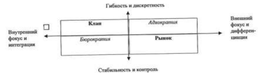
Рис. 1. Модель рамочной конструкции конкурирующих ценностей и соответствующих типов организационной культуры

- второе измерение отделяет критерии эффективности, которые подчеркивают внутреннюю ориентацию, интеграцию и единство, от критериев, ассоциируемых с внешней ориентацией, дифференциацией и соперничеством. Границы этого измерения простираются от организационной сплоченности и согласованности на одном краю до организационной разобщенности на другом